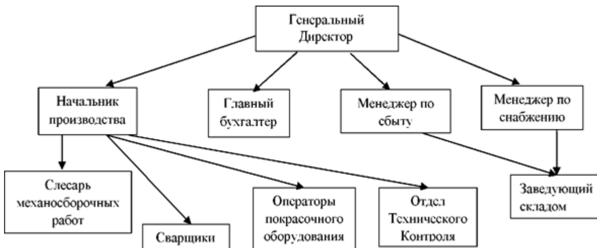
Рисунок 2- Организационная структура ООО «ЭлиПСМеТ»

Высший орган управления ООО «ЭлиПСМеТ» - общее собрание учредителей в лице генерального директора . Он же осуществляет руководство текущей деятельностью предприятия, а также несет материальную и административную ответственность за достоверность данных бухгалтерского и статистического отчетов. Общество имеет собственное имущество, самостоятельный баланс и расчетный счет. Организационная структура ООО «ЭлиПСМеТ» представлена на рисунке 2.